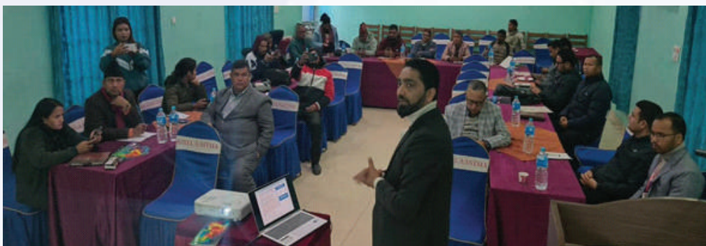
कार्यक्रममा सहभागीहरू ।

कार्यक्रममा सहभागीहरूले जीवन बीमातर्फ बीमालेख जबरजस्ती बेच्ने प्रवृत्ति रहेको, बीमा प्रक्रिया जटिल रहेको, बीमा साक्षरताको कमी रहेको, बीमालेख नबुझी बीमा गर्ने प्रवृत्ति रहेको, अनलाइन दाबी भुक्तानी प्रक्रिया प्रभावकारी नभएको लगायतका धारणा राख्नुभएको थियो । कार्यक्रममा सुदूरपश्चिम प्रदेशमा कार्यरत विभिन्न संचार माध्यमका आर्थिक पत्रकारहरूको सहभागिता रहेको थियो ।