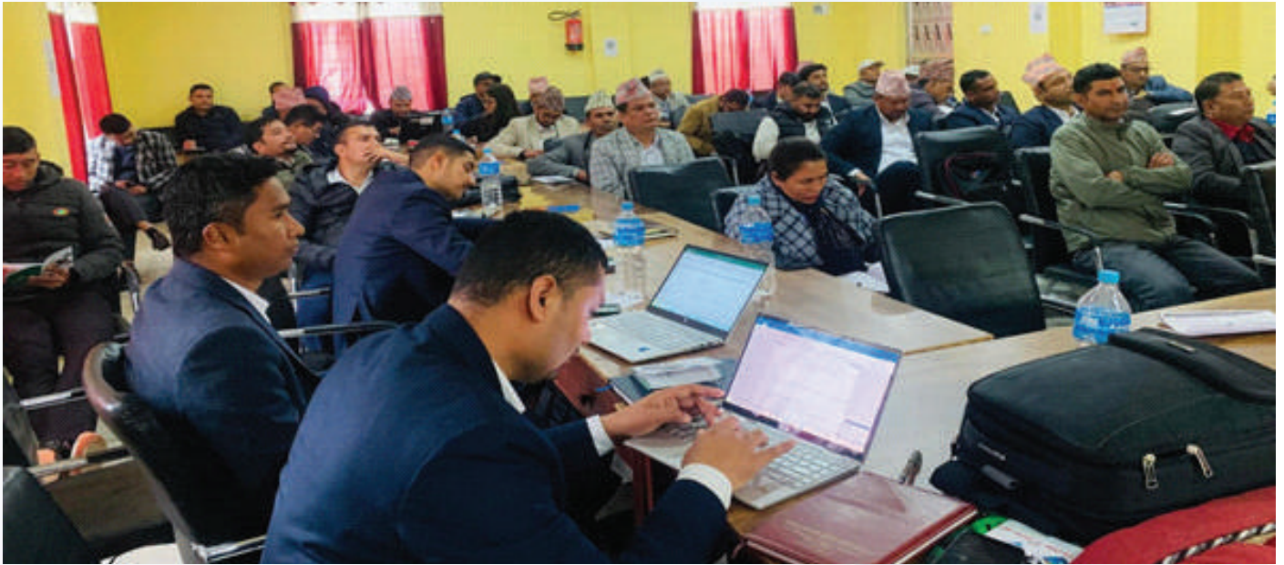
कार्यक्रममा सहभागीहरू ।

कार्यक्रममा सुदूरपश्चिम प्रदेश, भूमि व्यवस्था, कृषि तथा सहकारी मन्त्रालयका पदाधिकारी, कृषि ज्ञान केन्द्र, भेटनरी अस्पताल र पशु सेवा केन्द्रका प्रमुख