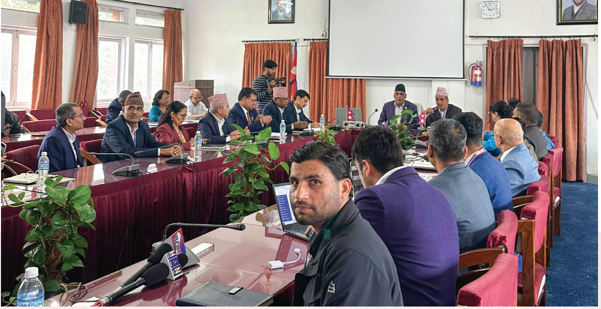
कृषि तथा पशुपन्छी विकास मन्त्री मानजीय रामनाथ अधिकारीको प्रमुख आतिथ्यमा आयोजित सफ्टवेयर संचालन शुभारम्भ कार्यक्रममा सहभागीहरू

कृषि तथा पशुपन्छी विकास मन्त्रालयको आर्थिक सहयोगमा नेपाल बीमा प्राधिकरणले 'कृषि तथा पशुपन्छी बीमा रियल टाइम सफ्टवेयर' निर्माण गरी संचालनमा ल्याएको छ । कृषि बीमा कार्यक्रमलाई थप व्यवस्थित र पारदर्शी बनाउँदै दुर्गम क्षेत्रका कृषक र न्यून आय भएका कृषक बर्गसम्म कृषि बीमाको पहुँच पुऱ्याउने उद्देश्यले नयाँ सफ्टवेयर संचालनमा ल्याइएको हो ।