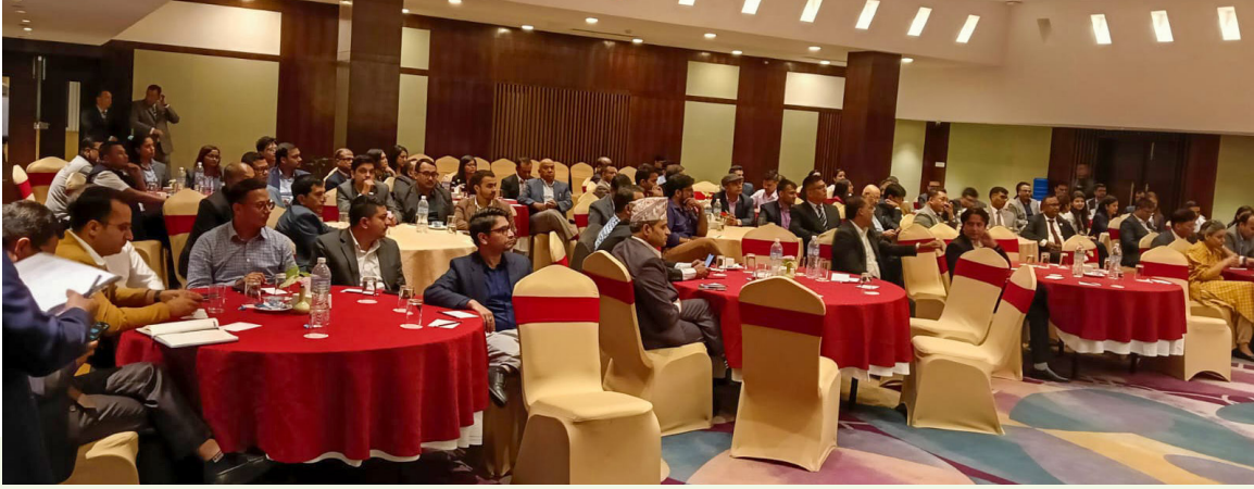
कार्यक्रममा सहभागीहरू ।

नेपाल बीमा प्राधिकरणको आयोजनामा यही २०८१ साल कात्तिक २ गते काठमाडौंमा नेपाल वित्तीय प्रतिवेदन मान-१७ (NFRS -17) कार्यान्वयनका लागि आवश्यक तयारी लगायतका विषयमा लेखासम्बन्धी नियामक निकाय तथा सरोकारवालाहरूसँग छलफल एवम् अन्तर्क्रिया कार्यक्रम सम्पन्न भएको छ ।