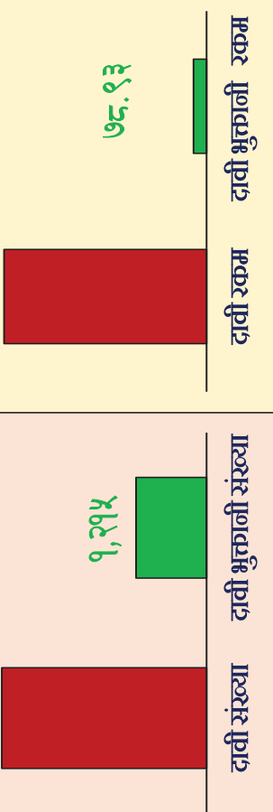
प्रदेश अनुसार बीमा दावी र भुक्तानी रकम (रु. करोडमा)