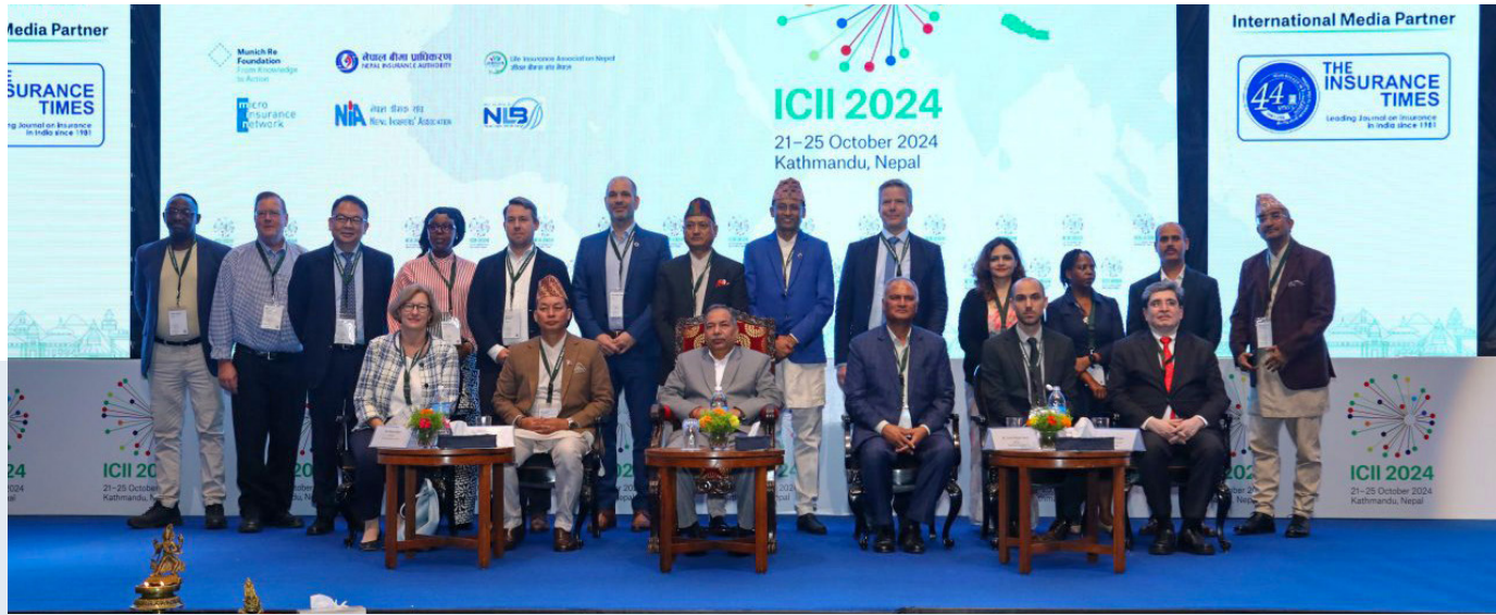
सम्माननीय उपराष्ट्रपति रामसहाय प्रसाद यादवका साथमा अतिथी तथा आयोजकहरू ।

समावेशी बीमा सम्बन्धी अन्तर्राष्ट्रिय सम्मेलन (International Conference on Inclusive Insurance -ICII 2024) यही २०८१ साल कार्तिक ९ गते काठमाडौंमा सम्पन्न भएको छ ।