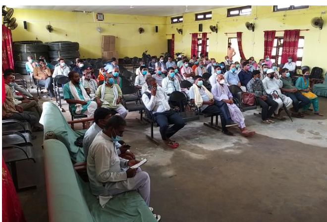
जलेश्वर नगरपालिकामा आयोजित कार्यक्रममा सहभागीहरू ।

बीमा समितिले स्थानीय तहमा बीमा सम्बन्धी जनचेतना अभिवृद्धिका कार्यक्रमलाई अभियानका रूपमा अघि बढाउने क्रममा प्रदेश नं. २ को महोत्तरीको जलेश्वर नगरपालिकामा बीमा सचेतना कार्यक्रम सम्पन्न भएको छ ।