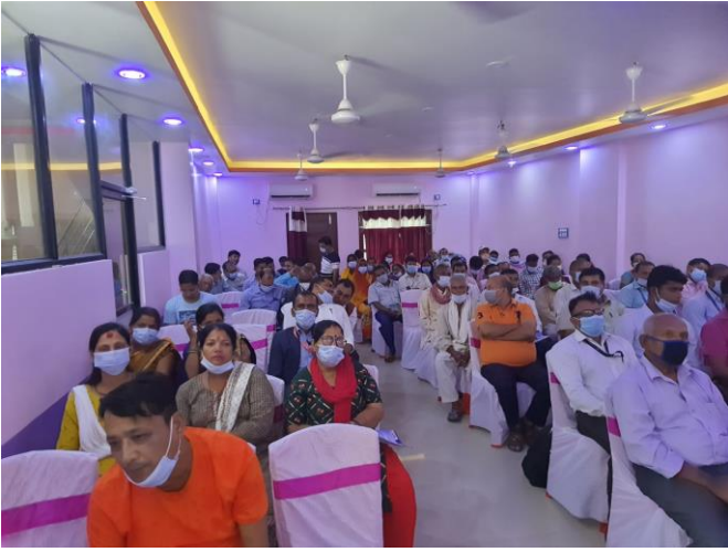
मलङ्गवा नगरपालिकामा आयोजित कार्यक्रममा सहभागीहरू ।

बीमा सम्बन्धी जनचेतना अभिवृद्धि गर्ने उद्देश्यले यही साउन १८ गते सर्लाहीको मलङ्गवामा बीमा सचेतना कार्यक्रम सम्पन्न भएको छ ।