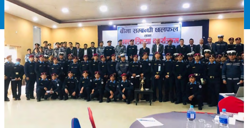
सुर्खेतमा आयोजित अन्तरक्रिया कार्यक्रममा सहभागीहरू।

नेपाल बीमा प्राधिकरण, कर्णाली प्रदेश कार्यालयको आयोजनामा बीमा सचेतना कार्यक्रम अन्तर्गत यही पुस ४ गते सुर्खेतमा प्रदेश प्रहरीसँग बीमा सम्बन्धी अन्तरक्रिया कार्यक्रम सम्पन्न भएको छ।