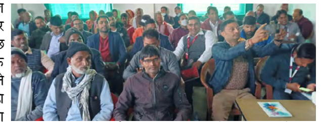
विश्रामपुर गा.पा.मा आयोजित अन्तरक्रिया कार्यक्रममा सहभागीहरू।