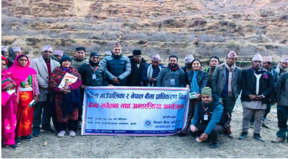
तिला गाउँपालिकामा आयोजित अन्तरक्रिया कार्यक्रममा सहभागीहरू।

सुर्खेत जिल्लाको चौकुने गाउँपालिकामा यही २०७९ मङ्सिर १६ गते आयोजित बीमा सचेतना कार्यक्रममा सहभागीहरूले बीमा दाबी भुक्तानीलाई सहज तुल्याउन नेपाल बीमा प्राधिकरणले जोड दिनुपर्ने, बीमा कम्पनीहरू गाउँ गाउँमा पुगनुपर्ने, गाउँपालिकाको