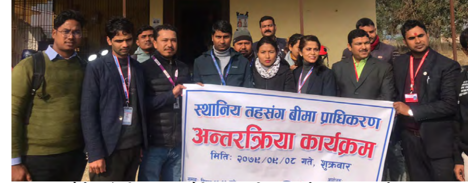
ठोरी गाउँपालिकामा आयोजित अन्तरक्रिया कार्यक्रममा सहभागीहरू।

एक-दुईवटा गाई भैंसी, कच्ची घर र दुई-चारवटा आँपका रूखको पनि बीमा गर्न तयार