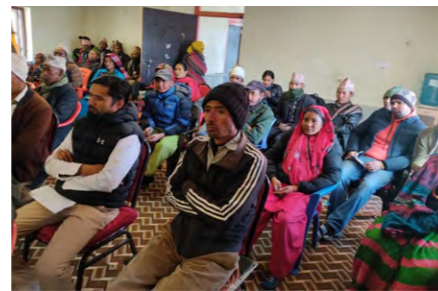
छाँयानाथ रारा न.पा. मा आयोजित अन्तरक्रिया कार्यक्रममा सहभागीहरू

यसअघि, जुम्लाको सिंजा र सुर्खेतको चिङ्गाड गाउँपालिका तथा सुर्खेतको गुर्भाकोट र कालिकोटको तिलागुफा नगरपालिकामा बीमा सचेतना कार्यक्रम सम्पन्न भइसकेका छन्। साथै, जिल्ला समन्वय समिति, कालिकोटको कार्यालयमा समेत बीमा सचेतना कार्यक्रम आयोजना गरिएको छ।