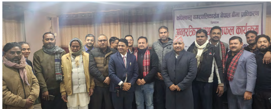
कपिलवस्तुमा आयोजित अन्तरक्रिया कार्यक्रममा सहभागीहरू।

नेपाल बीमा प्राधिकरणको आयोजनामा लुम्बिनी प्रदेशका कपिलवस्तु जिल्लाको कपिलवस्तु नगरपालिका र बाँके जिल्लाको राप्ती सोनाही गाउँपालिकामा बीमा सचेतना कार्यक्रम आयोजना गरिएको छ।