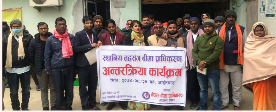
अन्तरक्रिया कार्यक्रममा सहभागी बीमा सर्भेयरहरू।

नेपाल बीमा प्राधिकरण, मधेश प्रदेश कार्यालयको आयोजनामा यही २०७९ साल मङ्सिर २८ गते बीरगञ्जमा बीमा सर्भेयरहरूसँग अन्तरक्रिया कार्यक्रम सम्पन्न भएको छ। बीमासर्भेयरको कामलाई छिटोछरितो बनाउने तथा सर्भेयरका समस्याहरूका बारेमा छलफल गरी समाधानका उपाय पहिचान गर्ने उद्देश्यले कार्यक्रम आयोजना गरिएको हो।