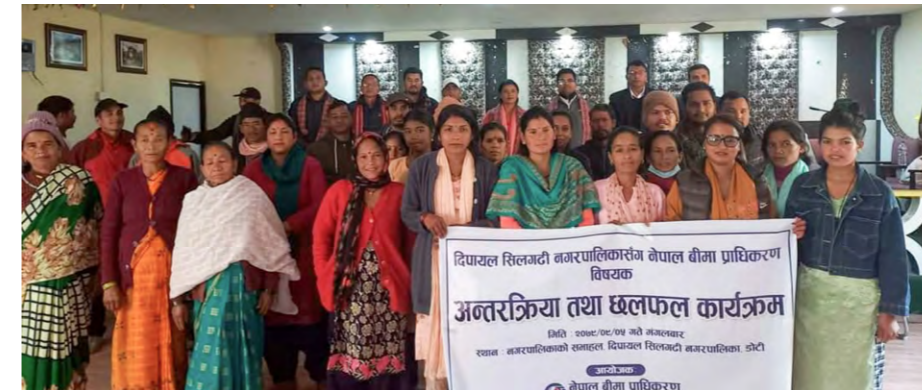
दिपायल सिलगढीमा आयोजित अन्तरक्रिया कार्यक्रममा सहभागीहरू।

नेपाल बीमा प्राधिकरण, सुदूरपश्चिम प्रदेश कार्यालयको आयोजनामा सुदूरपश्चिम प्रदेशका कञ्चनपुर, बाजुरा, अछाम र डोटी जिल्लामा बीमा सम्बन्धी जनचेतनामूलक कार्यक्रमहरू आयोजना गरिएको छ। जसअनुसार, कञ्चनपुर जिल्लाको कृष्णपुर नगरपालिकामा यही २०७९ साल मङ्सिर २९ गते, बाजुरा जिल्लाको बूढीगङ्गा नगरपालिकामा यही २०७९ साल पुस ३ गते, अछाम जिल्लाको साँफेबगर नगरपालिकामा पुस ४ गते र डोटी जिल्लाको दिपायल सिलगढी नगरपालिकामा पुस ५ गते तथा शिखर नगरपालिकामा पुस ६ गते कार्यक्रमहरू आयोजना गरिएको हो।